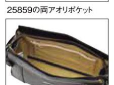
25859の両アオリポケット