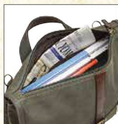
本体直通ファスナー