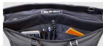
正面オープンポケット内部