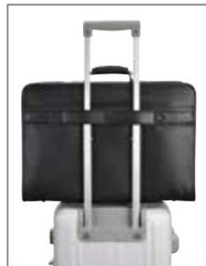
キャリーバー通し