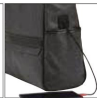
ケーブルホール ※ケーブルはついていません