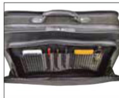
アウトポケット内部