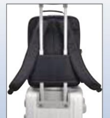
キャリーバー通し