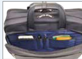
アウトポケット内部