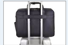
キャリーバー通し