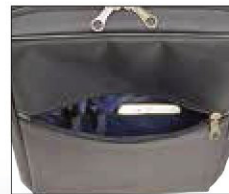
ファスナーポケット内部