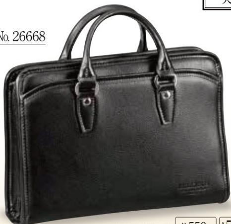
29×20×6 約550g A5F