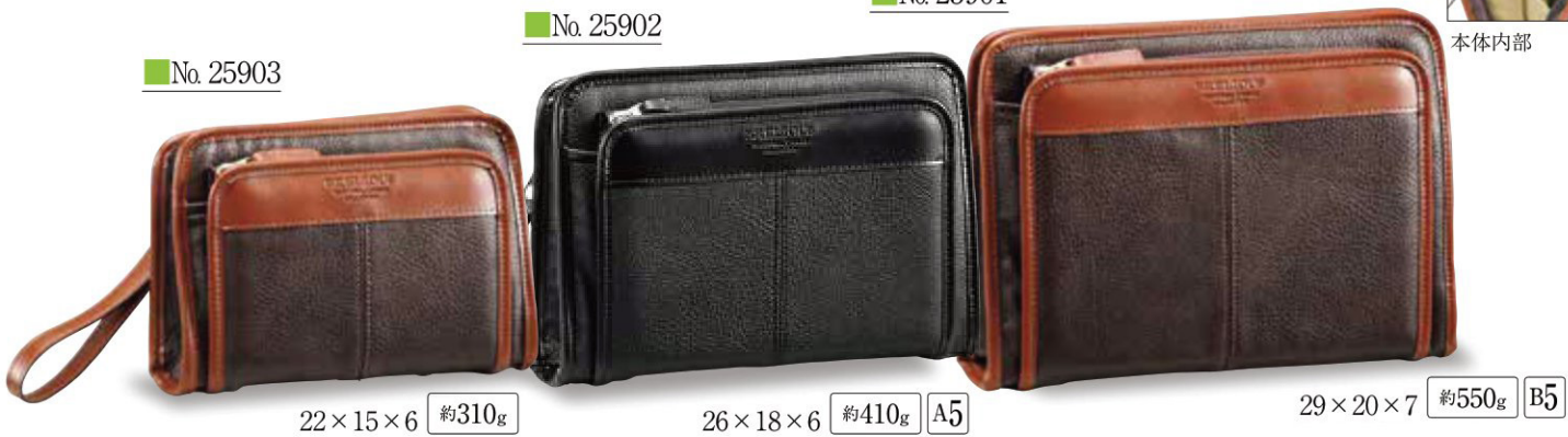
22×15×6 約310g 26×18×6 約410g A5 29×20×7 約550g B5