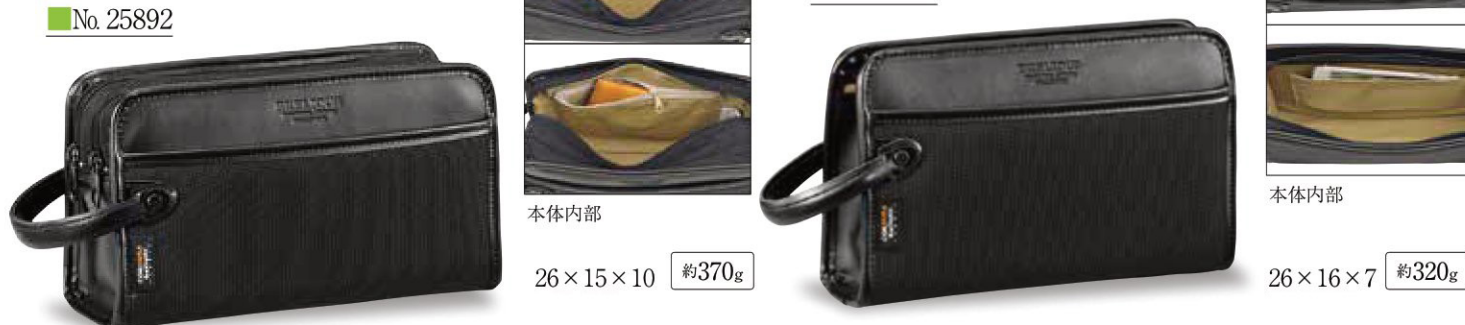
26×15×10 約370g 26×16×7 約320g