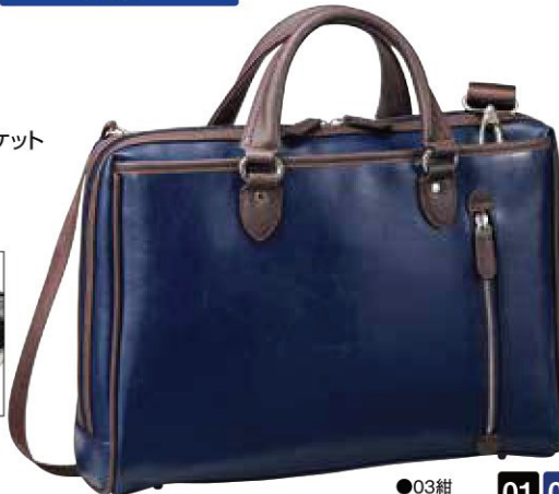
正面アオリポケット内部