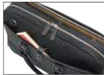
26605の正背面のポケット