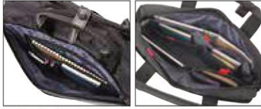
共通の前ポケット内部