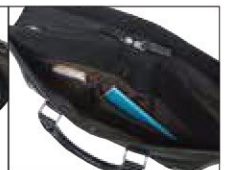
26581の正面ポケット内部