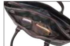
26577の正面ポケット内部