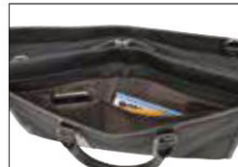
26579の正面ポケット内部