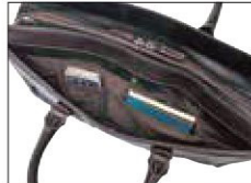
26576の正面ポケット内部