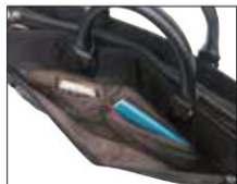
26578の正面ポケット内部