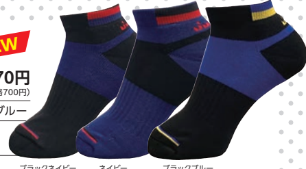
ブラックネイビー

●サイズ 22~24cm / 25~27cm ブラックブルーは25~27cmのみ