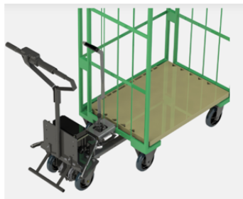
カゴ台車取付イメージ

最大積載量: 1トンまで運搬可能（運搬例: 400kgの台車を2台連結して移動）