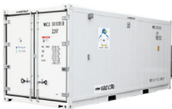
例:20フィート冷凍冷蔵コンテナ

JPRは大型コンテナも取り揃えております。温度管理ができるので、食品・化学品・薬品・原料等の保管に。一時的なクリスマスやおせちの食材管理にもおすすめです。ドライコンテナもあります。購入やレンタルなど、ご要望に合わせご紹介いたします。お気軽にご相談ください。