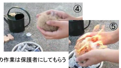
ここからの作業は保護者にしてもらい 急に火がつくので気を付ける

火鑽杵の回転にムラができたり、止まってしまうと 芯棒が急に冷え、固くなってしまいます。 固くなるとスムーズに回転しなくなる場合があるので、その場合 芯棒の焦げた部分を小刀で削り、他の火鑽臼でやり直してみてください。