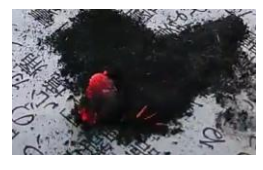
できた火種の様子