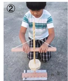
上下運動を始める