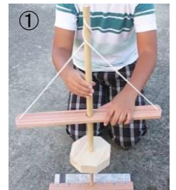
火鑽杵に火鑽糸を巻き付ける