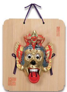
No.1234 蘭陵王面 (中) 6,000円(税込) 縦24.6×横21.2cm