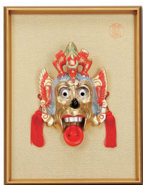
No.1235 蘭陵王面 (大) 18,000円(税込) 縦40×横30cm