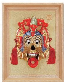
No.1236 蘭陵王面 (特大) 30,000円(税込) 縦43×横33cm