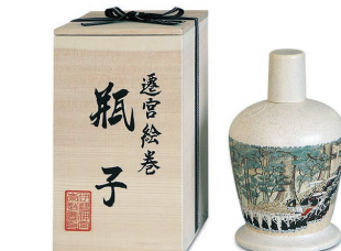
No.398 瓶子 5,000円(税込) 高20cm