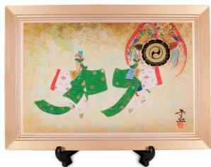
No.4301 舞楽陶額(皇仁庭) 3,500円(税込) 縦21×横30cm