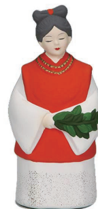
No.1485 倭姫命人形 赤 1,500円(税込) 高14cm