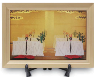
No.3714 舞楽陶額(倭舞) 3,500円(税込) 縦21×横30cm