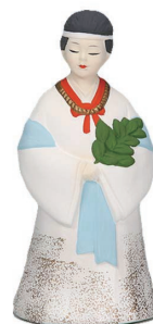
No.1486 倭姫命人形 白 1,500円(税込) 高14cm