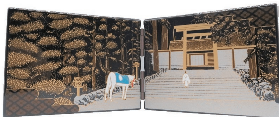
No.4200 蒔絵屏風(神馬) 3,500円(税込) 縦10.3×横28.5cm

日本独自の伝統工芸である蒔絵を施した屏風です。 熟練した職人が1つ1つ丹精を込めて謹製致しました。