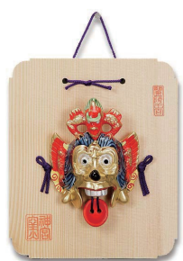
No.1233 蘭陵王面 (小) 4,000円(税込) 縦21.2×横18cm