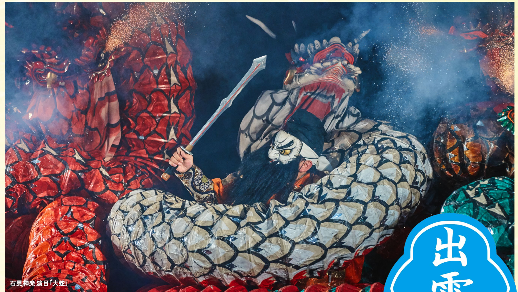
石見神楽 演目「大蛇」

豊かな自然と、 職人が生み出す 逸品から 「真心」を込めて 最高の品々を お届けいたします。