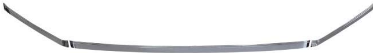
フロントロアスカートガーニッシュ 3P