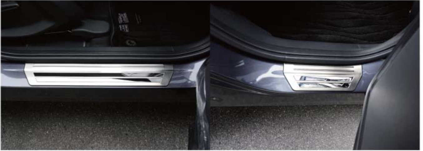
— 外側スカッフプレート取付けイメージ —