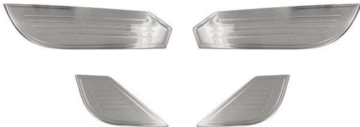
サイドドア内側ドアキックガード 4P