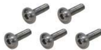
六角ボルト 5P(うち1個は予備) M4×16mm