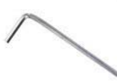
六角ボルト用レンチ 1P 2.5mm