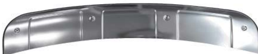
リアアンダーカバーガーニッシュ 1P