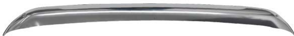
フロントアンダーカバーガーニッシュ 1P