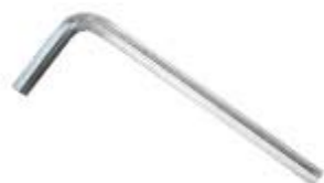
鬼目ナット用レンチ 1P 4mm