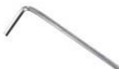
六角ボルト用レンチ 1P 2.5mm