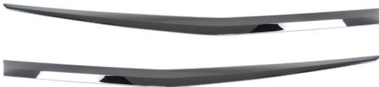
リアガーニッシュ(エンブレム周り) 2P