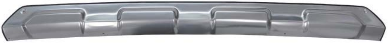
リアアンダーカバーガーニッシュ 1P