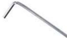
六角ボルト用レンチ 1P 2.5mm