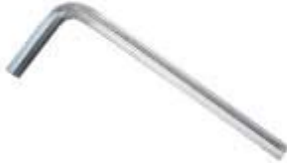
鬼目ナット用レンチ 1P 4mm