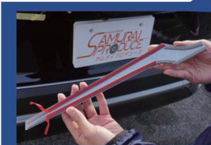
左側・右側パーツ

8) マーキングした位置をしっかりと確認しながら、左側→中央→右側と順番に右へ向かってパーツを取り付けます。