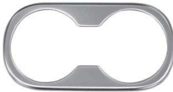
ドリンクホルダーパネル 2P