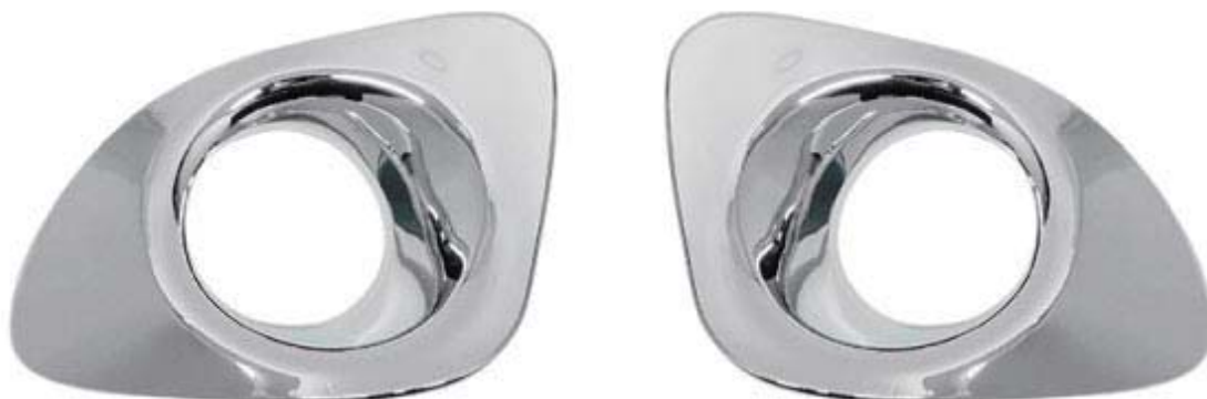
フロントフォグガーニッシュ 2P