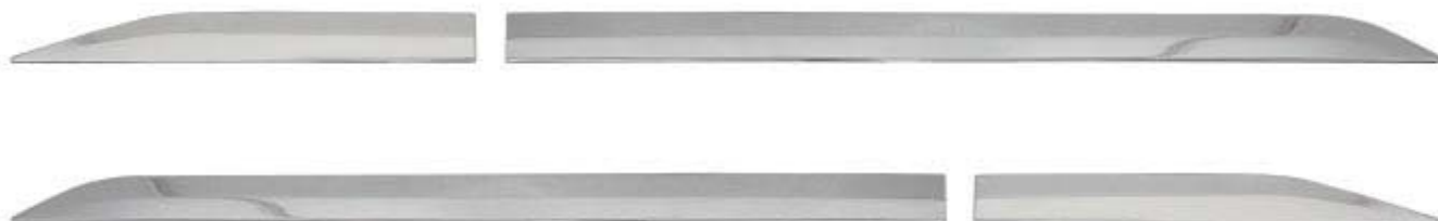
サイドガーニッシュ 4P