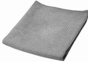
マイクロファイバー クロス(灰色)