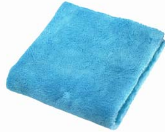
マイクロファイバー クロス(青色)