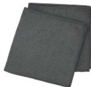
拭き上げ用クロス×2