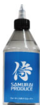
ウォータースポット リムーバー