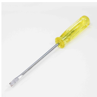
マイナスドライバー