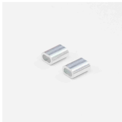
ストッパー×2 (1個は予備)