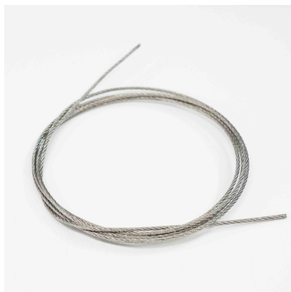
落下防止ワイヤー×1