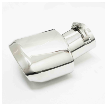
マフラーカッター×1