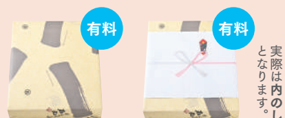
実際は内 のし となり ます。