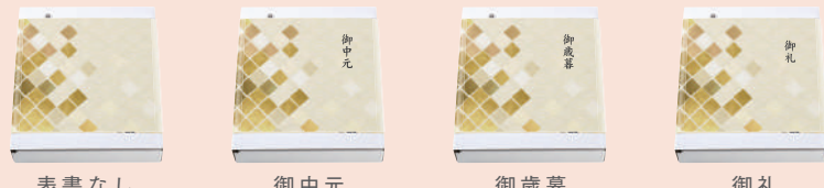
表書なし 御中元 御歳暮 御礼 ※かけ紙は、御中元、御歳暮、御礼以外の表書には対応しておりません。