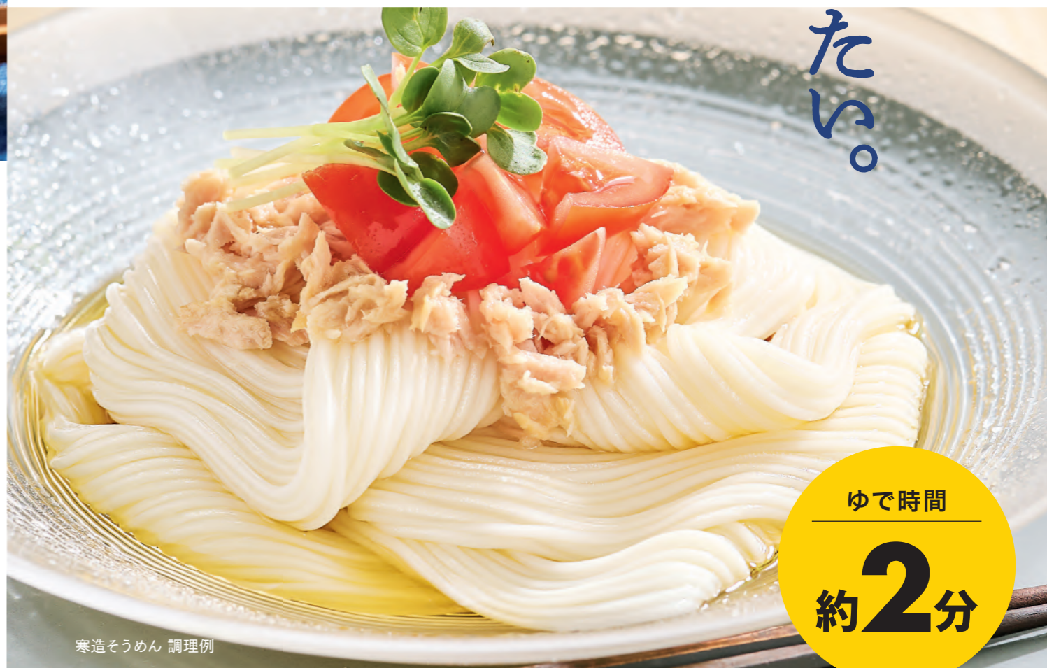
寒造そうめん 調理例