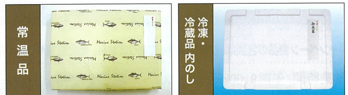
※短冊のし ※オリジナル包装紙で包装します。 ※(外のシタイプ)も承っております。