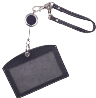
[AK-68-25S#41] [HS-240S#41] [CC-1S#41]使用例