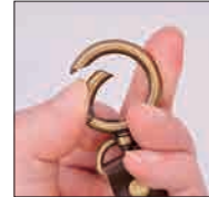
しっぽナスカン部分