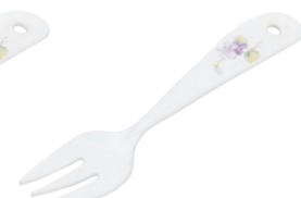
101-0156 スミレ プチフォーク