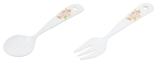
101-0049 ダイアナローズ プチスプーン