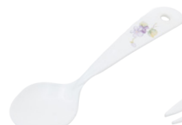
101-0155 スミレ プチスプーン