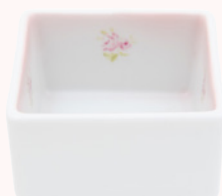
112-0403 ローズバスケット