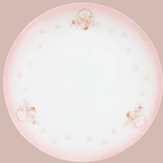
112-1070 ケーキ皿 ¥4,400 (¥4,000) <1P> Φ19 H2.5 ニューボン 日本製