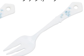
101-0066 クラリス クラシカル プチフォーク