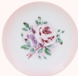
112-1122 プリンセスローズ