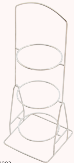
136-0003 スイーツスタンド3段 フレームのみ ¥1,980 (¥1,800) 〈1P〉 約 10 × 10 × H28 リング内径Φ7.3 対応皿サイズΦ約 9cm まで ベトナム製

プチ小皿 各¥1,980 (¥1,800) 〈1P〉 Φ8.8 H1.3 磁器 日本製