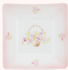
112-0408 ローズバスケット