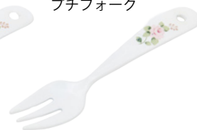
101-0004 エマ プチフォーク