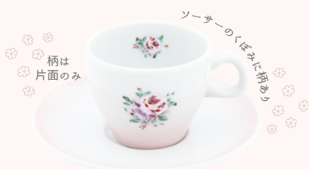
113-0112 プリンセスローズ