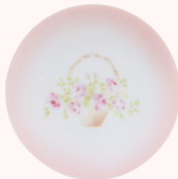
113-0089 ローズバスケット