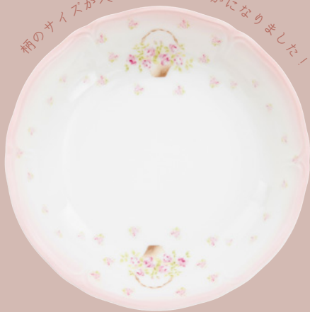
112-1078 New パスタプレート ¥4,950 (¥4,500) <1P> Φ21.3 H3 磁器 日本製