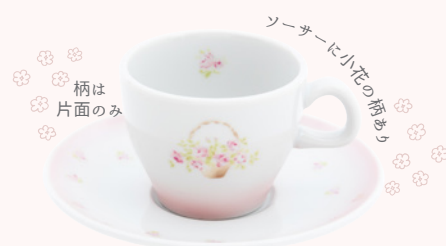
113-0055 ローズバスケット