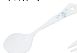
101-0065 クラリス クラシカル プチスプーン