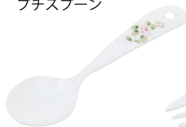
101-0003 エマ プチスプーン