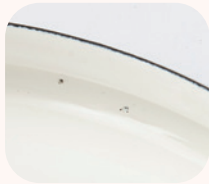
蓋や縁の内側などに吊るし跡