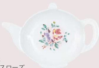
101-0235 プリンセスローズ ティーバッグトレー 各¥1,980 (¥1,800) <2P> W9.8 D6.5