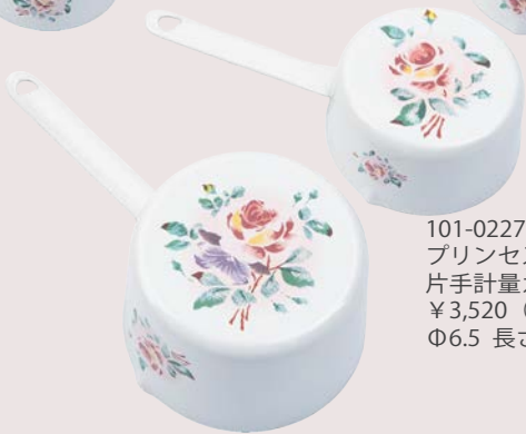
101-0227 プリンセスローズ 片手計量カップ 100ml ¥3,520 (¥3,200) <1P> Φ6.5 長さ 14 H3.5