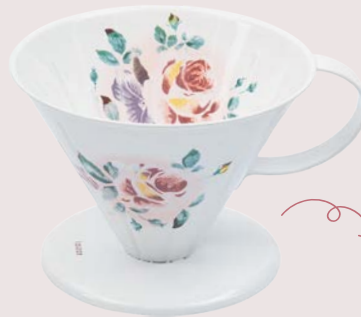
101-0259 プリンセスローズ コーヒードリッパー L ¥9,900 (¥9,000) <1P> W14 H8.7 珐瑯 (ステンレススチール珐瑯) 日本製