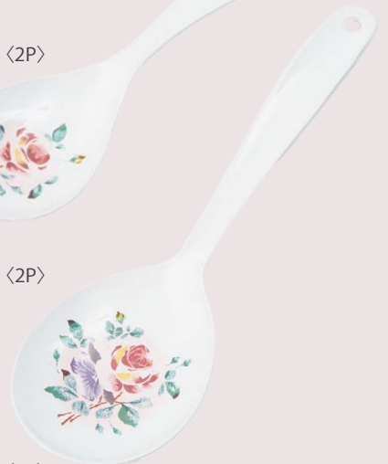
101-0246 プリンセスローズ とりわけスプーン大 各¥3,520 (¥3,200) <2P> 長さ 22