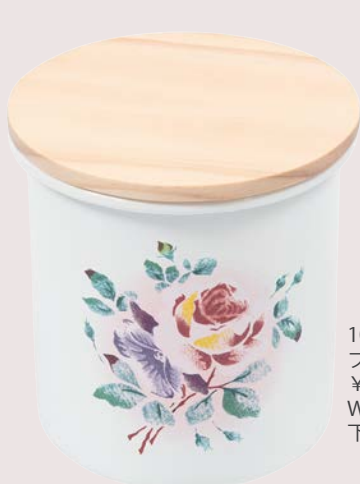
102-0203 プリンセスローズ 木プタキャニスター ¥9,900 (¥9,000) <1P> W10.8 D10.8 H11.1 750ml 珐瑯 (珐瑯用鋼板) 下地は中国 絵付けから仕上げまで国内生産