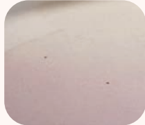
炉内の粉塵の付着