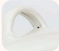
持ち手の内側や縁など釉薬のかかりにくい部分