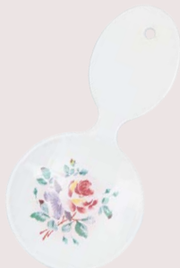
101-0243 プリンセスローズ ティーサーバースプーン 各¥1,980 (¥1,800) <2P> 長さ 9.5