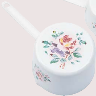
101-0226 プリンセスローズ 片手計量カップ 200ml ¥3,960 (¥3,600) <1P> Φ8 長さ 17.5 H5