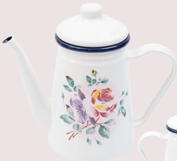
102-0201 プリンセスローズ コーヒーポット ¥14,960 (¥13,600) <1P> W21.5 D11 H19.5 1.1L 珐瑯 (珐瑯用鋼板) 直火 (ガス火) 対応 下地は中国 絵付けから仕上げまで国内生産 ※IH 電磁調理器 (100・200V) 非対応