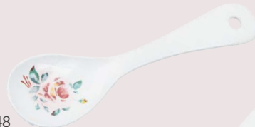
101-0248 プリンセスローズ とりわけスプーン小 各¥2,530 (¥2,300) <2P> 長さ 14.7