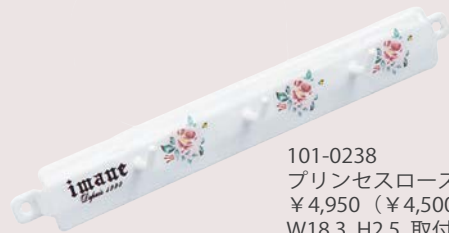
101-0238 プリンセスローズ ミニフック ¥4,950 (¥4,500) <1P> W18.3 H2.5 取付穴Φ0.3