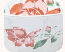
コーヒードリッパー柄飛び