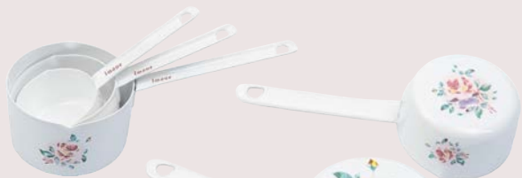
101-0228 プリンセスローズ 片手計量カップ 50ml ¥2,970 (¥2,700) <1P> Φ5.5 長さ 12 H2.3

白く艶やかなホーローに咲く凛としたバラの花 置くだけでキッチンが華やかに 使えば使うほど 暮らしの何気ない一コマが 美しい物語へ