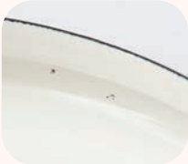
蓋や縁の内側などに吊るし跡 素地や下釉薬の見え