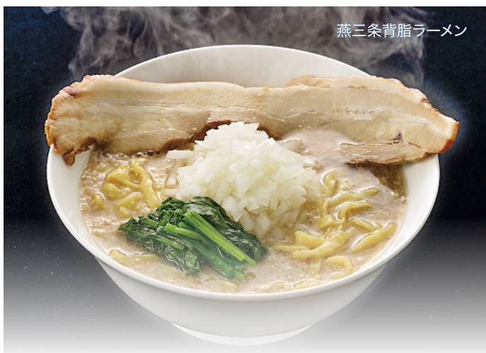
燕三条背脂ラーメン