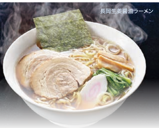
長岡生姜醤油ラーメン