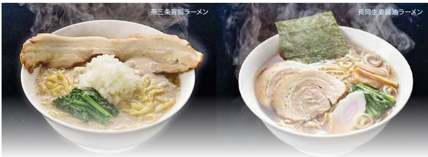
燕三条背脂ラーメン