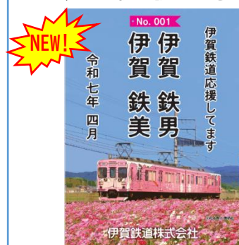
忍者列車プレート