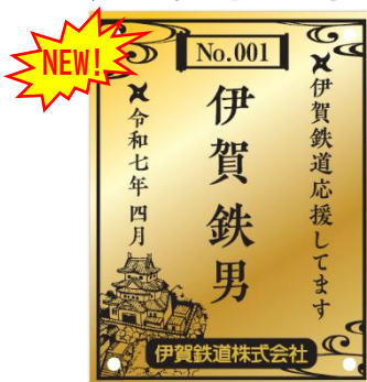
ゴールドプレート