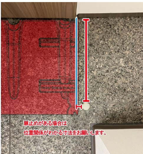
<扉止めがある場合 ※真上からのイメージ>

【まとめ】 気になる箇所、設置物、障害物は予め出来るだけ情報があると積算がスムーズになりますのでご協力ください。 また、建物の図面があれば併せてお送りいただきますと助かります。 その他、ご不明な箇所、気になる形状もお気軽にご相談ください。 本製品はあくまで土嚢に代わるものなので、完全に水を止めるものではありませんのでご注意ください。