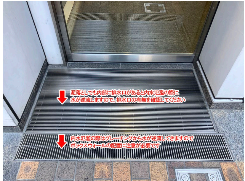
<グレーチングがある場合>