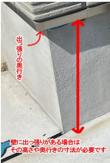
<出っ張りがある場合>