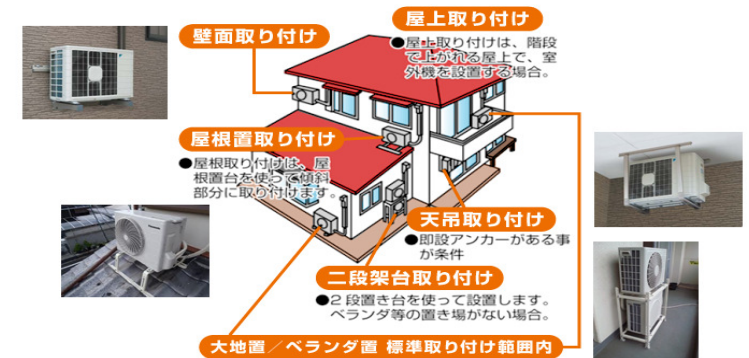
エアコン工事設置例