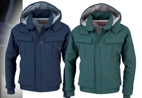
10. コン 60. グリーン