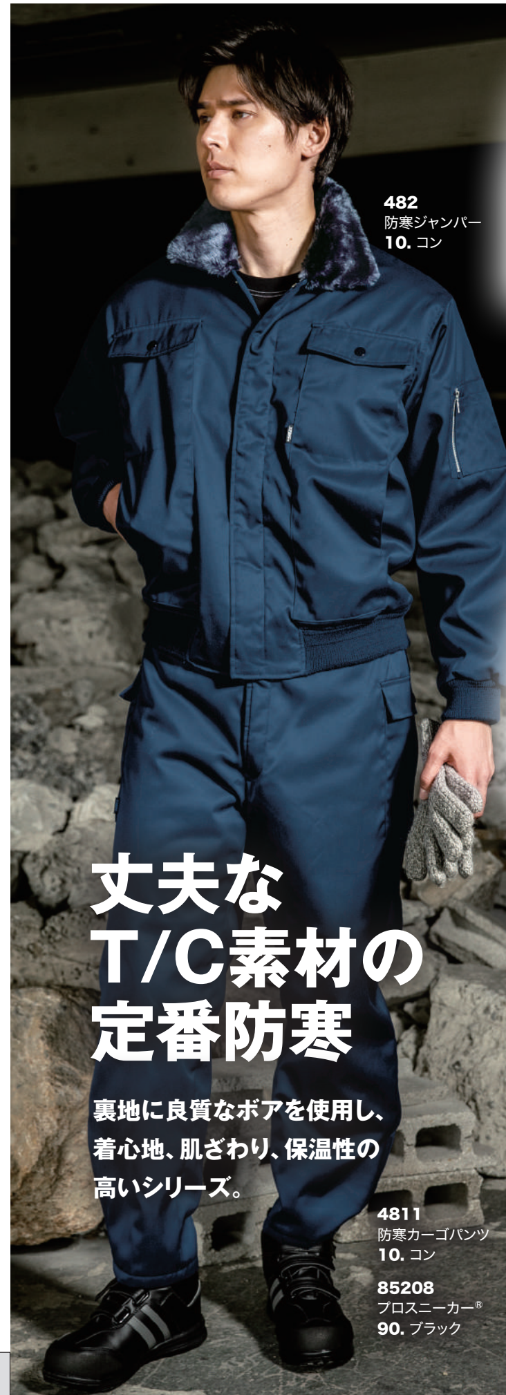
482 防寒ジャンパー 10. コン