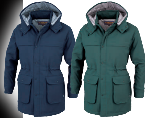
10. コン 60. グリーン

POINT ▶ 撥水加工を施した丈夫な素材 ▶ コートにはハンドウォーマーの付いたダブルポケット装備 ▶ 取り外し可能フード付き