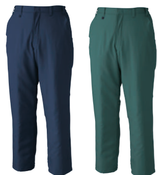
10. コン 60. グリーン