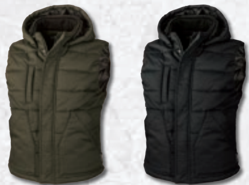
62. アーミーグリーン