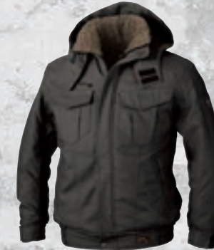
91. ストーンブラック