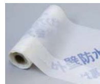
気密シート (セツトと同梱)