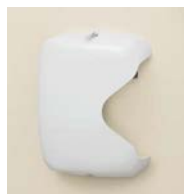
ポスト受箱(室内側)