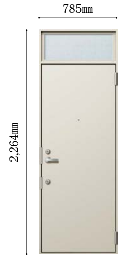
ドア高さ：DH=19(ランマ付)