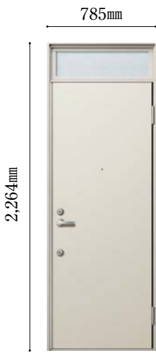
ドア高さ：DH=20(ランマ付)