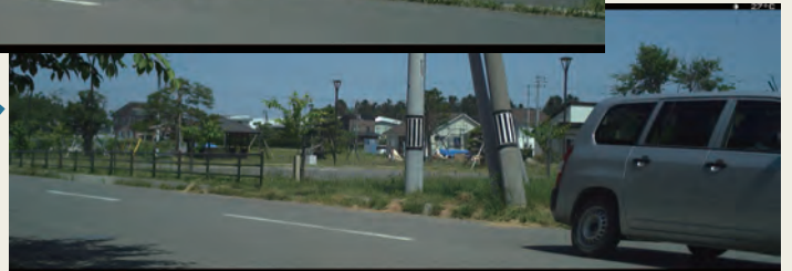
HL2XCにて撮影：時速60キロ