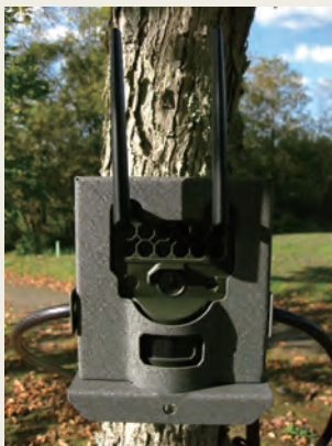
HL2XC セキュリティパッケージ 設置例