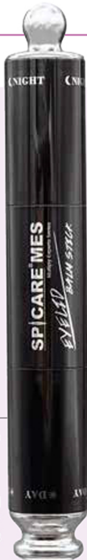
アイリッドバームスティック