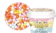
レインボーアイス