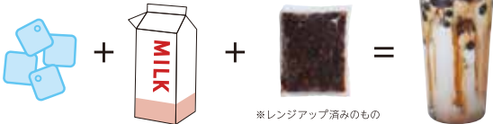
※レンジアップ済みのもの