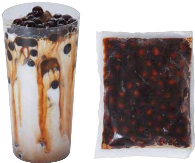
※パッケージデザインは変更になる場合がございます。予めご了承下さい。

マルイ物産では、こだわりの食感に加え、タピオカパール自体に味が付いている画期的なタピオカを開発いたしました。味付きのタピオカは1食分ずつ冷凍されているので、管理がしやすくロスがありません。さらにドリンク用ソースと一緒に冷凍されているので、調理も簡単。湯煎か電子レンジで解凍するだけ。