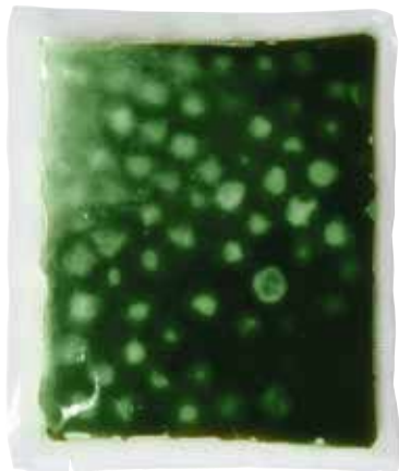
※パッケージデザインは変更になる場合がございます。予めご了承ください。

マルイ物産では、こだわりの食感に加え、タピオカパール自体に味が付いている画期的なタピオカを開発いたしました。 味付きのタピオカは1食分ずつ冷凍されているので、管理がしやすくロスがありません。さらにドリンク用ソースと一緒に冷凍されているので、調理も簡単。湯煎か電子レンジで解凍するだけ。