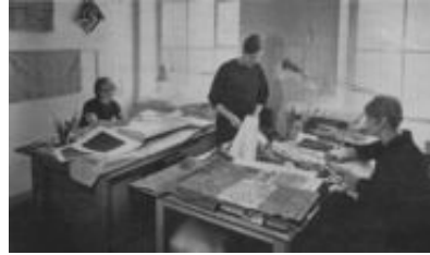
1950年代のデザインスタジオの様子