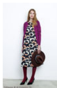
フェリシモで販売中のワンピース、柄は200周年記念デザインのアンヌッカ