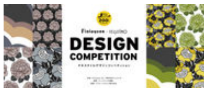
200周年記念デザインがあしらわれたデザインコンペ応募サイト