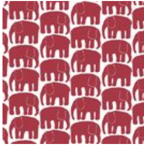
1969年の学生コンテストから生まれた大 人気のエレファンティ