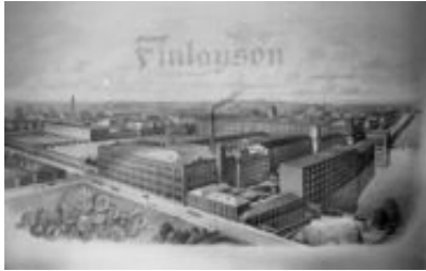
創業初期のフィンレイソンの工場(1830年 代)