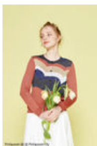
フェリシモで販売中のカーディガン、柄は200周年記念デザインのクムルス