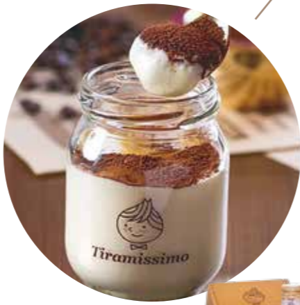
〈ティラミッシモ〉 ティラミス | 6個 | 4,480円(税込) 内容量:6個:プレーン・抹茶・チョコレート・黒ごま・ミックスブルーベリー・ピスタチオよりお選びいただけます。 配送方法: 冷凍