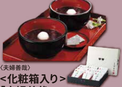
〈夫婦善哉〉 <化粧箱入り> 「夫婦善哉」 | 8P | 4,900円(税込) 内容量:175g×8パック入り 配送方法: 常温 ※「夫婦善哉」