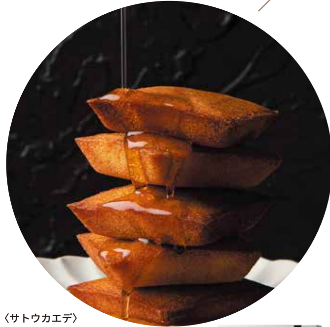
〈サトウカエデ〉 箕面フィナンシェ | 12個 | 3,024円(税込) 内容量:12個 配送方法: 常温

こだわりのサクサクのサブレにホワイトチョコ入りの、 軽やかなバタークリームをサンドです。