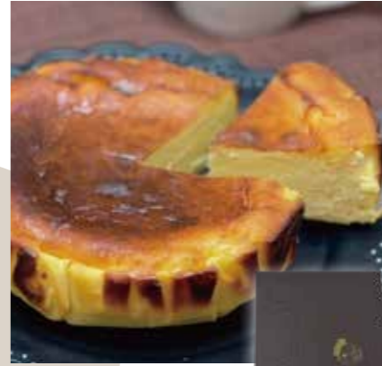
〈iBASQUE〉 茨木バスクチーズケーキ プレーン | 直径 12cm | 3,500円(税込) 内容量:350g(直径12cm) 配送方法: 冷凍

2種類のクリームチーズに北海道産の生クリームを加えたなめらかな舌触りを楽しめます。