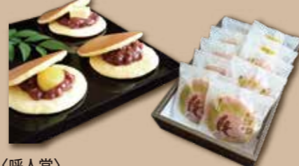
〈呼人堂〉 大阪枚方銘菓『暁』 小倉・栗・バター 人気商品詰め合わせ | 3種 | 3,226円(税込) 内容量:3種 計10個:暁(粒あん) 5個、栗入り暁:3個、バター入り暁:2個 配送方法: 常温 ※「あかつき(粒あん)」

大阪産名品に認証されている長崎堂のカ スターラをはじめ、和洋菓子が一度に楽し めます。