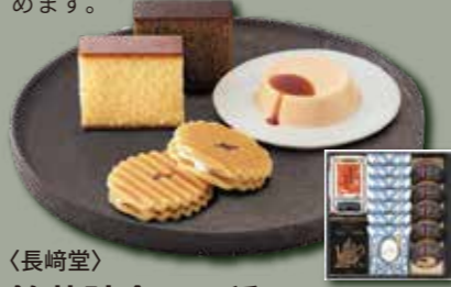
〈長崎堂〉 銘菓詰合せ4種セット | 4種 | 4,768円(税込) 内容量:4種:カスターラ(5切入) 1箱、珈琲カスターラ (5切入)1箱、ヴァッフェル (7枚入)1箱、プリンアトリエ (5個入)1箱 配送方法: 常温 ※「カスターラ(プレーン)」・「ヴァッフェル」

大阪産名品に認証されている長崎堂のカ スターラをはじめ、和洋菓子が一度に楽し めます。