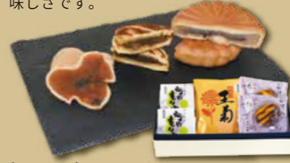
〈かつら屋 もん 大阪産3種詰め合わせ | 3種 | 4,500円(税込) 内容量:3種 計5個:王菊 1個、河内もなか 2個、河内の一押し 2個 配送方法: 常温 ※「いちじく」 ※「風土銘菓 河内もなか」・「献上菓子 王菊」

それぞれ3種類の商品は、多くの受賞歴を 誇る名品です。大切な方にも喜ばれる美 味しさです。