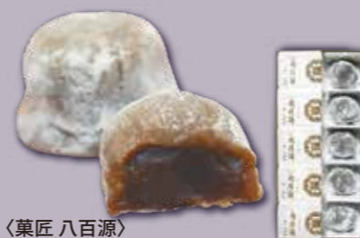
〈菓匠 八百源〉 元祖 肉桂餅 | 10個 | 3,150円(税込) 内容量:10個 賞味期限:商品到着日より常温で8日 配送方法: 常温 ※「肉桂餅」

それぞれ3種類の商品は、多くの受賞歴を 誇る名品です。大切な方にも喜ばれる美 味しさです。