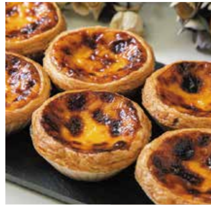
〈アンドリュウのエッグタルト〉 アンドリュウの エッグタルト | 9個 | 4,180円(税込) 内容量:9個 配送方法: 冷凍