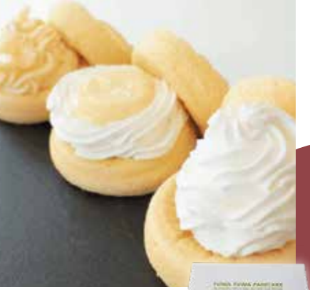
〈cafeblow〉 カスタード ふわふわパンケーキ | 3種 | 2,680円(税込) 内容量:3種:プレーン、カスタード生クリーム、レモンカスタード 配送方法: 冷凍