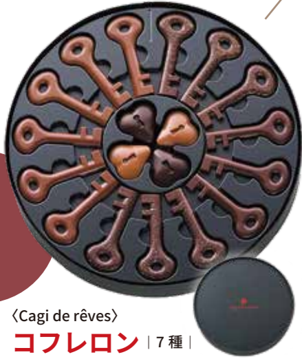
〈Cagi de rêves〉 コフレロン | 7種 | 2,936円(税込) 内容量:7種:鍵型 15本(カカオ75%、カカオ64%、カカオ55%、カカオ50%、カカオ38%) 各3本、ハート型チョコレート 4個(カカオ87.5%、カカオ33%) 各2個 配送方法: 冷蔵

厳選した食材と熟練パティシエの技術が生み出 した、濃厚でなめらかな食感のティラミスです。