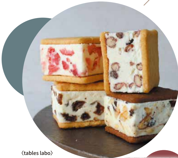
〈tables labo〉 堀江バターサンド プレミアムBOXセット | 8個 | 5,500円(税込) 内容量:4種 計8個:レーズンバター、イチゴミルク、塩あんバター、ティラミス 各2個 配送方法: 冷凍