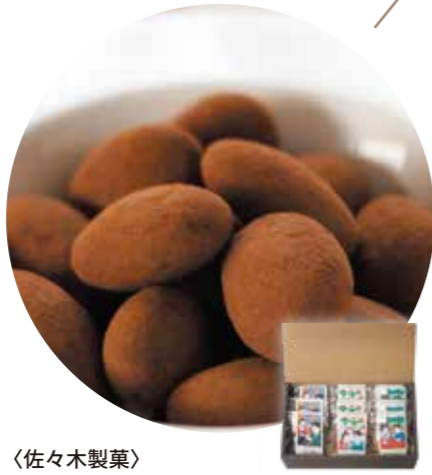
〈佐々木製菓〉 小分け包装アーモンドチョコ アソートセット | 3種 | 3,300円(税込) 内容量:3種 計9袋:つぶつぶチョコいちごアーモンド、ココアチョコアーモンド、キャラメルホワイトチョコアーモンド 各3袋 配送方法: 常温