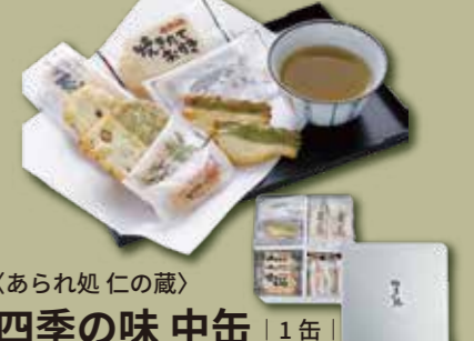
〈あられ処 仁の蔵〉 四季の味 中缶 | 1缶 | 4,347円(税込) 内容量:430g 配送方法: 常温