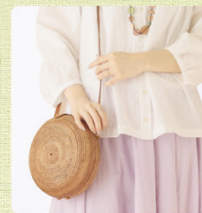
夏の服との相性 バツグン! 〈アタ製 丸形ショルダー Bag〉 ¥9,680